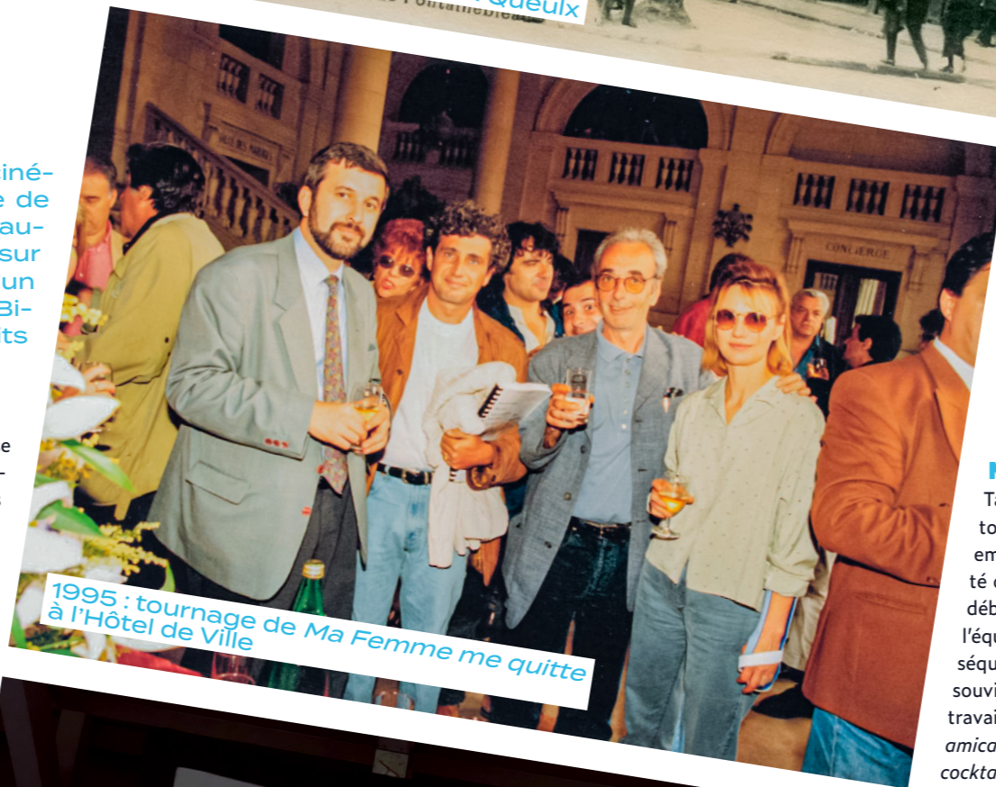
1995 : tournage de Ma Femme me quitte à l'Hôtel de Ville