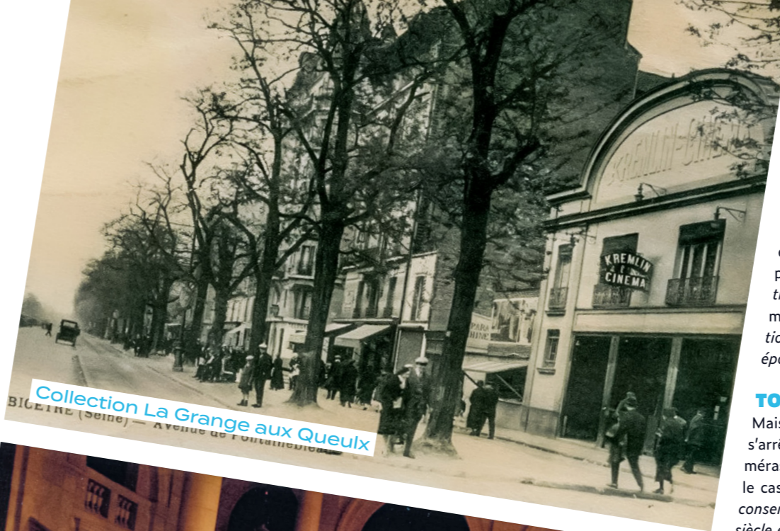
BICÊTRE (Seine) — Avenue de Fontainebleau