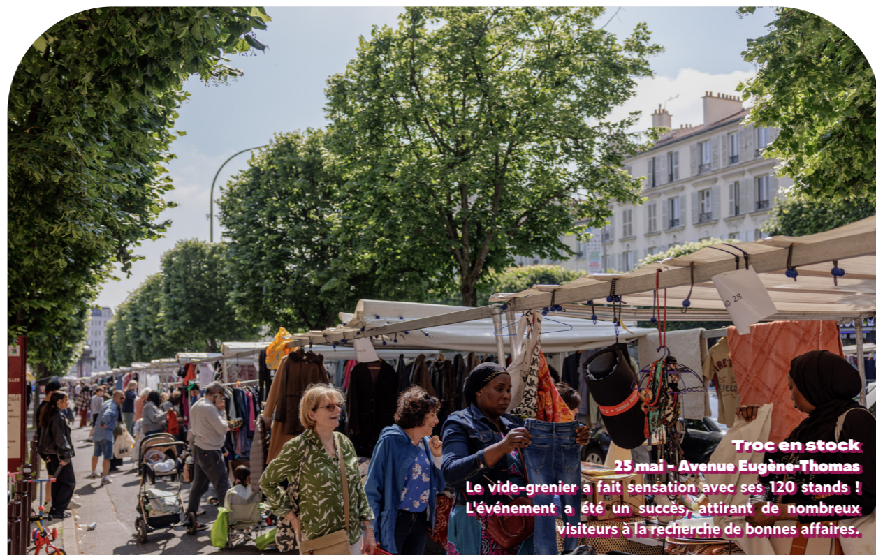
Troc en stock 25 mai - Avenue Eugène-Thomas Le vide-grenier a fait sensation avec ses 120 stands ! L'événement a été un succès, attirant de nombreux visiteurs à la recherche de bonnes affaires.