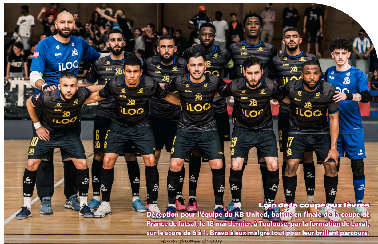
Loin de la coupe aux lèvres Déception pour l'équipe du KB United, battue en finale de la coupe de France de futsal, le 18 mai dernier, à Toulouse, par la formation de Laval, sur le score de 6 à 1. Bravo à eux malgré tout pour leur brillant parcours.