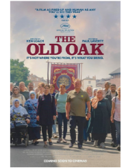
THE OLD OAK de Ken Loach

RETROUVEZ TOUS LES ÉVÉNEMENTS DE LA MÉDIATHÈQUE SUR L'ÉCHOGRAMME