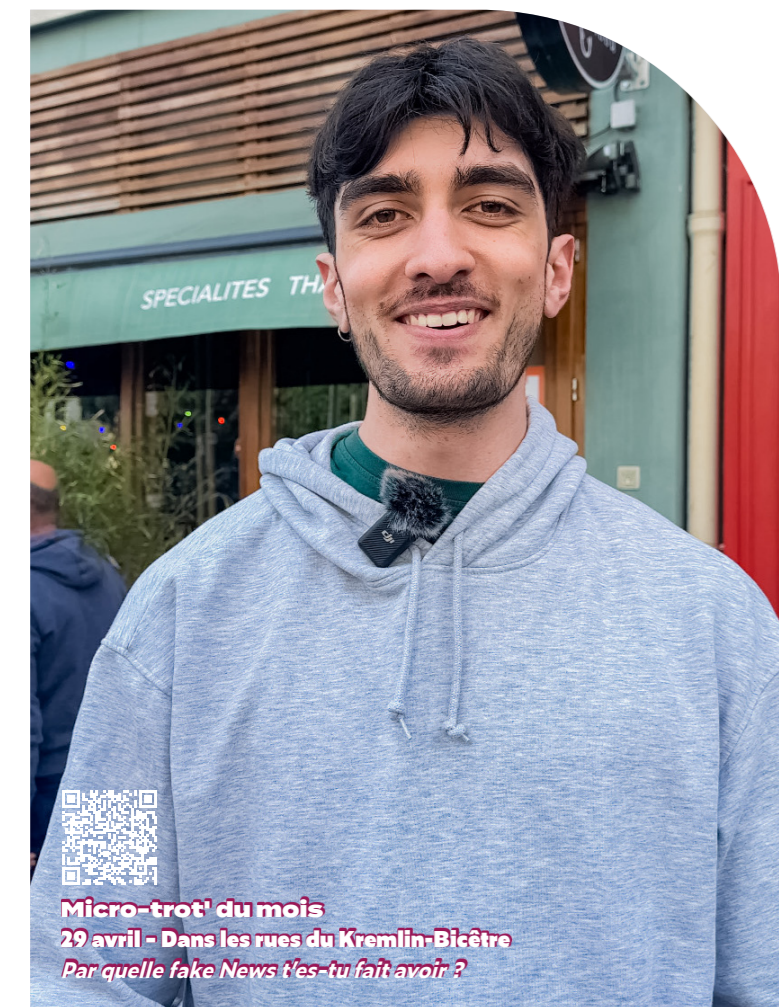
Micro-trot' du mois 29 avril - Dans les rues du Kremlin-Bicêtre Par quelle fake News t'es-tu fait avoir ?