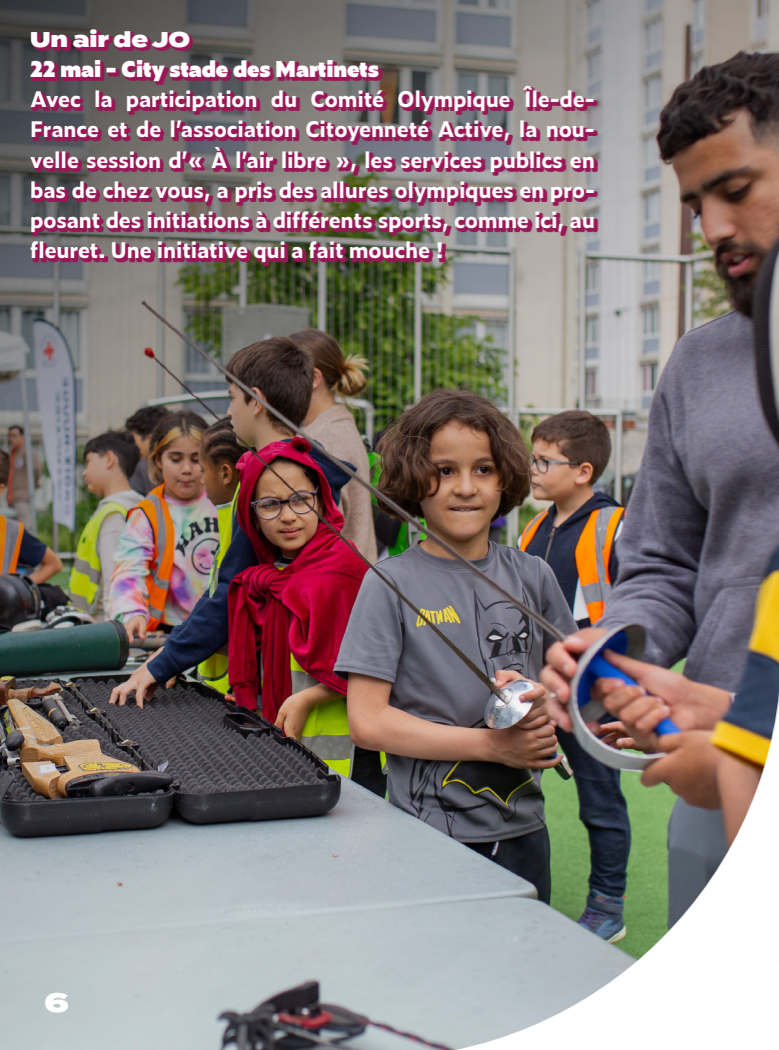
Un air de JO 22 mai - City stade des Martinets Avec la participation du Comité Olympique Île-de-France et de l'association Citoyenneté Active, la nouvelle session d'« À l'air libre », les services publics en bas de chez vous, a pris des allures olympiques en proposant des initiations à différents sports, comme ici, au fleuret. Une initiative qui a fait mouche !