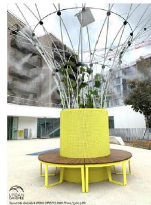
URBAN CONCRETE Des objets, des idées & des idées ORFÈVRE 2008 Référence du produit

2 canopées dont 1 installée sur une fontaine afin d'éviter du génie civil et donc une dépendance trop importante et 1 avec un banc circulaire.