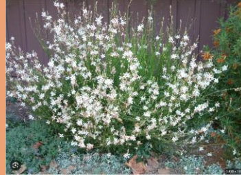
Gaura lindheimeri Geyser White