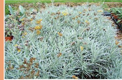
Helichrysum angustifolia Curry