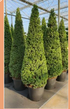
Ilex crenata Maxima