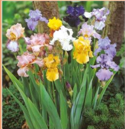
Iris germanica variés