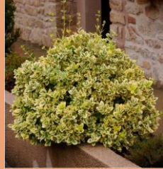
Euonymus fortunei Emerald'n Gold