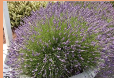
Lavandula intermedia Grosso