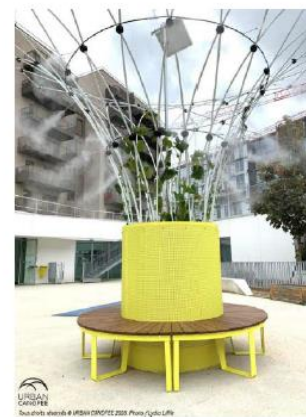
URBAN CONCEPT Des objets, des idées & des idées ORCHESTRA 2018 Référence du produit

2 canopées dont 1 installée sur une fontaine afin d'éviter du génie civil et donc une dépendance trop importante et 1 avec un banc circulaire.