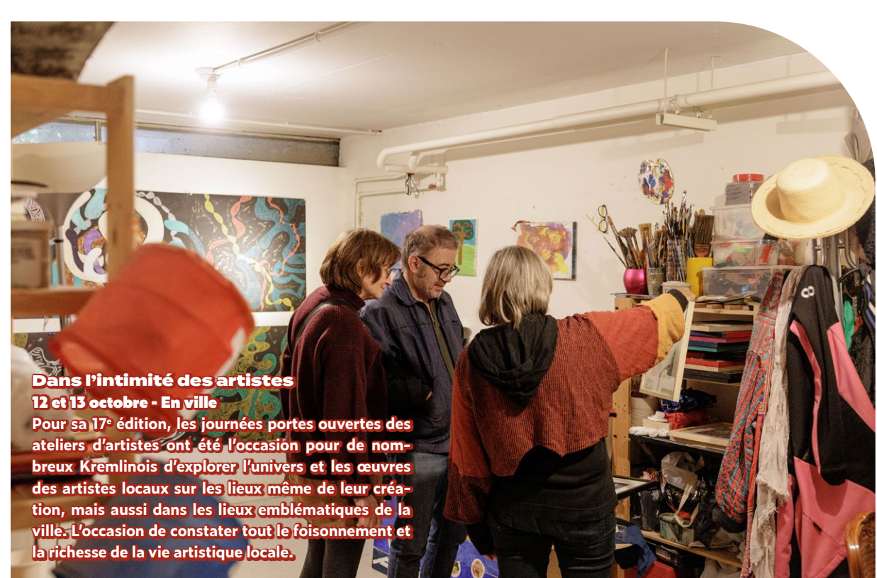
Dans l'intimité des artistes 12 et 13 octobre - En ville Pour sa 17 e édition, les journées portes ouvertes des ateliers d'artistes ont été l'occasion pour de nombreux Kremlinois d'explorer l'univers et les œuvres des artistes locaux sur les lieux même de leur création, mais aussi dans les lieux emblématiques de la ville. L'occasion de constater tout le foisonnement et la richesse de la vie artistique locale.