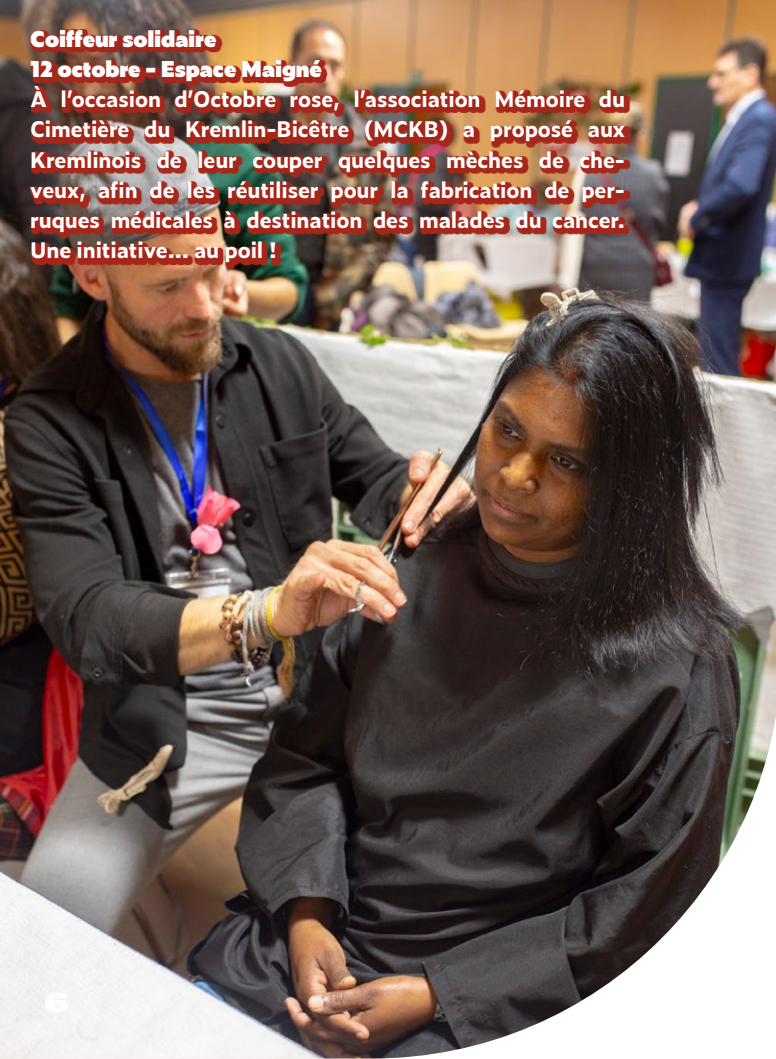
Coiffeur solidaire 12 octobre - Espace Maigné À l'occasion d'Octobre rose, l'association Mémoire du Cimetière du Kremlin-Bicêtre (MCKB) a proposé aux Kremlinois de leur couper quelques mèches de cheveux, afin de les réutiliser pour la fabrication de perruques médicales à destination des malades du cancer. Une initiative... au poil !