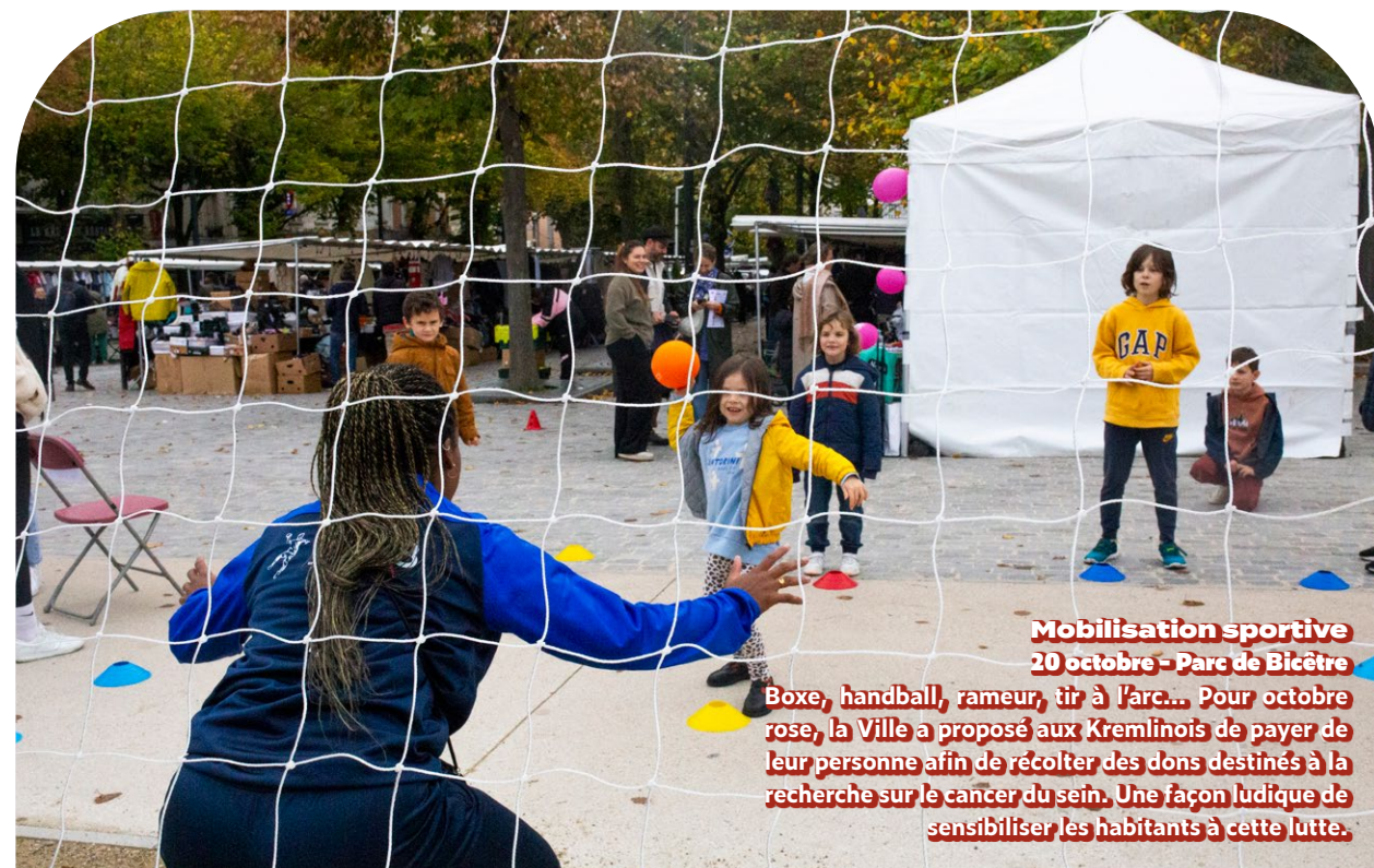
Mobilisation sportive 20 octobre - Parc de Bicêtre Boxe, handball, rameur, tir à l'arc... Pour octobre rose, la Ville a proposé aux Kremlinois de payer de leur personne afin de récolter des dons destinés à la recherche sur le cancer du sein. Une façon ludique de sensibiliser les habitants à cette lutte.