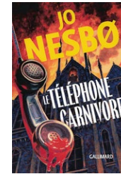
LE TÉLÉPHONE CARNIVORE de Jo Nesbo