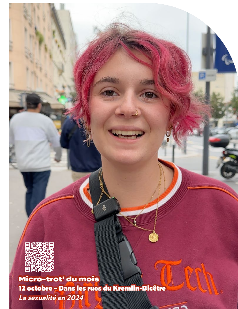
Micro-trot' du mois 12 octobre - Dans les rues du Kremlin-Bicêtre La sexualité en 2024