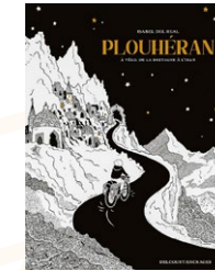
PLOUHÉRAN : À VÉLO, DE LA BRETAGNE À L'IRAN d'Isabel Del Real