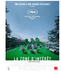
LA ZONE D'INTÉRÊT de Jonathan Glazer

RETROUVEZ TOUS LES ÉVÉNEMENTS DE LA MÉDIATHÈQUE SUR L'ÉCHOGRAMME