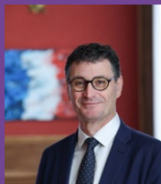
JEAN-FRANÇOIS DELAGE Maire du Kremlin-Bicêtre