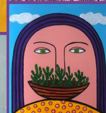
© Dana Sereda, Doina Vieru, Victoria Cozmolici, Luminita Mihailicenco, Vasiluta Vasilache